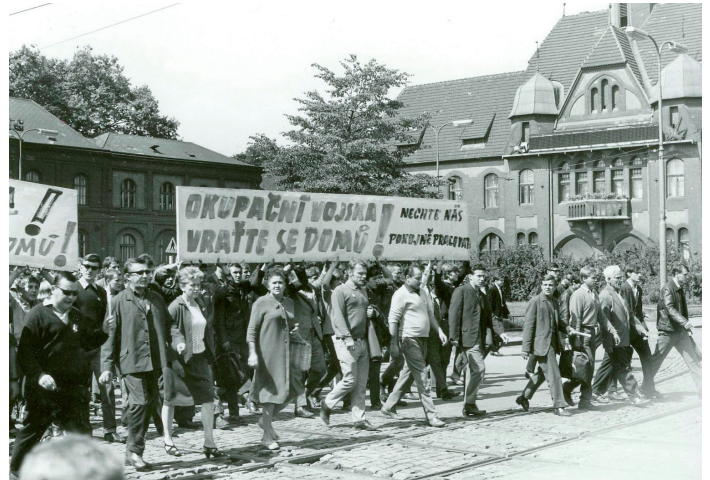
Srpen 1968 ve Vítkovicích.