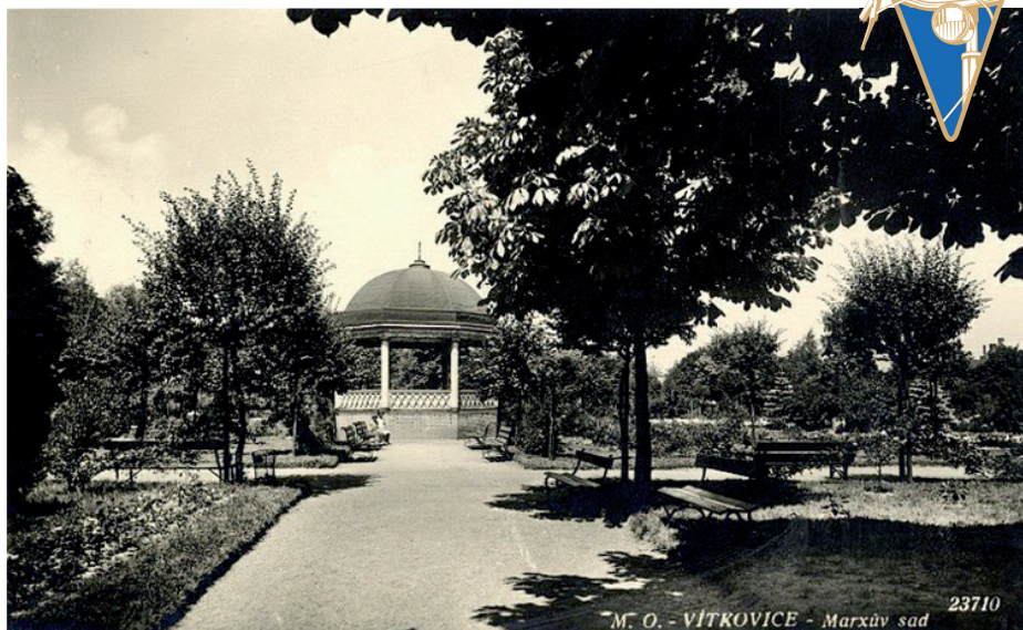
Marxův sad, dnes sad J. Jabůrkové.