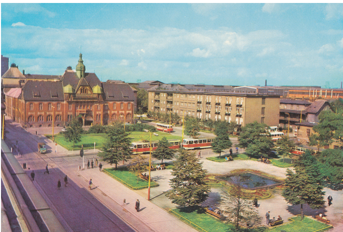
Mírové náměstí, 1971.