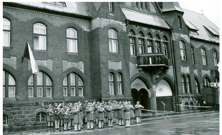
Slavnostní otevření vítkovické radnice, 6. dubna 1992.